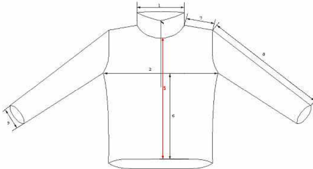
Abbildung 1: Unterziehhemd, KSK, vorne