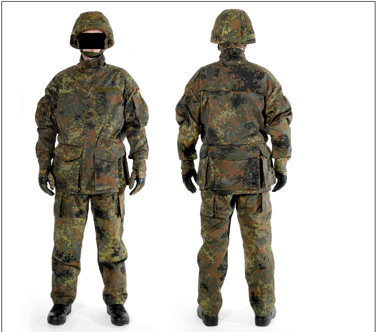
Abbildung 1: Kampfjacke lang, vorn und hinten