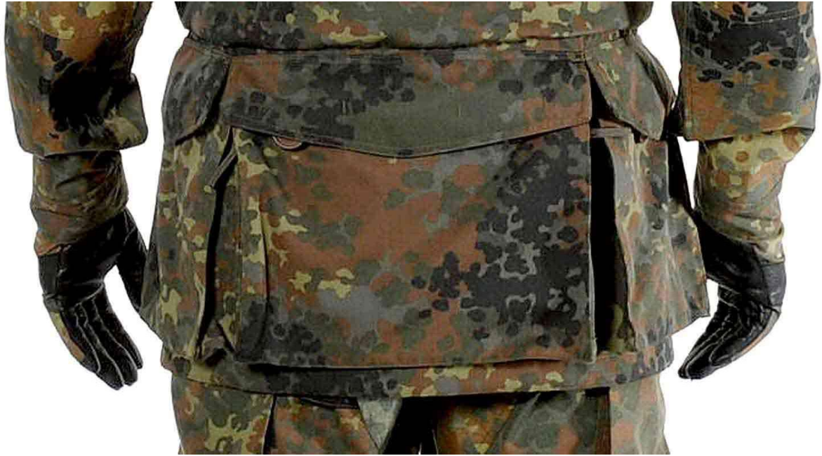
Abbildung 3: Kampfjacke lang, hinten